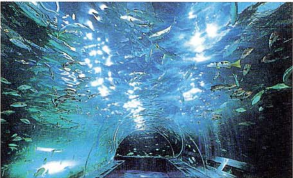
海の散歩道(トンネル水槽)

水族館営業時間 AM10:00~PM5:00(入館はPM4:30まで) 休館日 毎週火曜日(当日が祝祭日の場合は翌平日) 電話 03-3762-3431