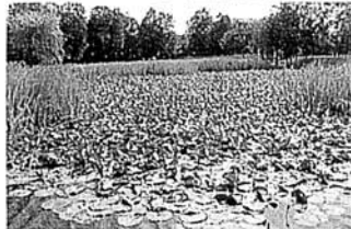
はなしょうぶ 見頃6月中旬 開花期 6月初旬～下旬

スイレン、マコモ、ヒシ、ガマ、アシ、クワイなど9科、22種の水生植物が植えられています。